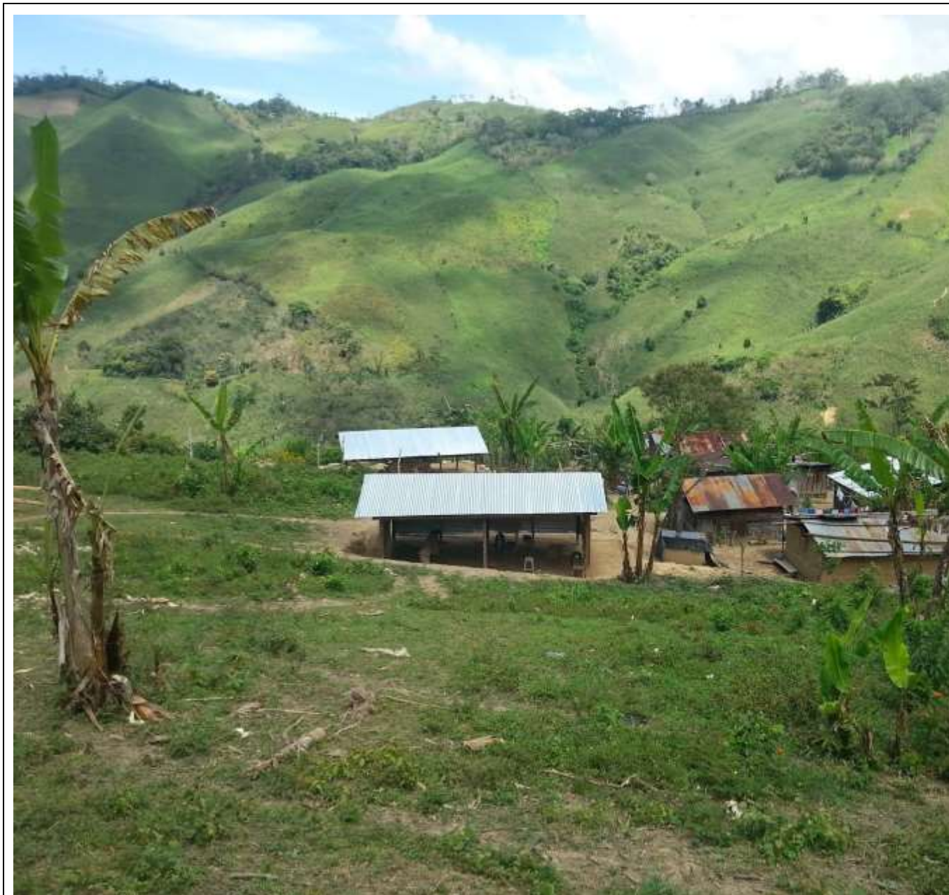
Construido en el 2016