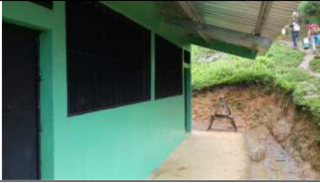
Punto de Partida